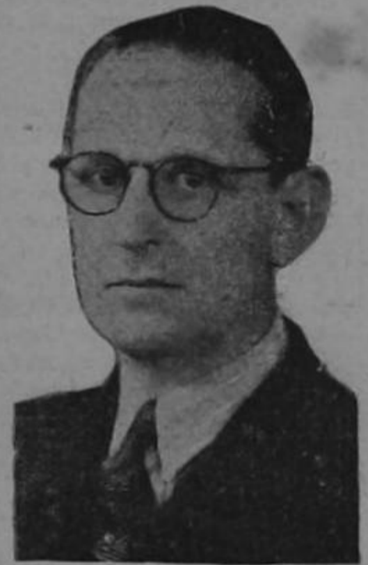
Don Carlos Manuel Escalante, Ministro de Hacienda

El día cuatro de los corrientes celebró su día onomástico el señor secretario de hacienda y comercio, don Carlos Manuel Escalante. Con ese motivo un grupo de amigos dispuso hacerle un festejo. Pero al trascender la noticia muchas personas quisieron unirse al agasajo y el acto alcanzó relieves fastuosos. Varios cientos de ciudadanos, con sus respectivas esposas, se reunieron en el Country Club, instalado en San Rafael de Escazú, por iniciativa de un grupo de caballeros que han creído necesario que la capital tenga un lugar de recreo, en las afueras de la ciudad, donde el turista, el visitante y aun las propias familias josefinas, puedan tener su rato de esparcimiento, al puro aire, dentro de un ambiente muy criollo.